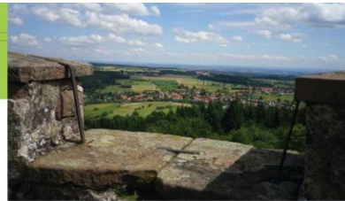
Ausblick vom Katzenbuckel