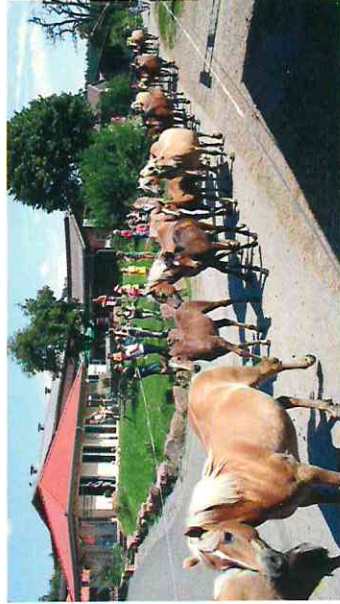
Ausblick vom Katzenbuckel